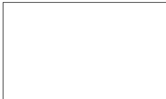
Menschwerdung, Kreuzigung und Auferstehung Jesu